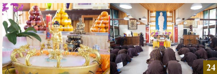
圖 24：淨宗學院與 RBIT 首次共同舉辦「浴佛節慶典」。

5 月 4 日，淨宗學院與 RBIT 首次舉辦「浴佛節慶典」，恭賀本師釋迦牟尼佛聖誕，敬邀 上 悟 下 道法師、淨宗學院眾法師及同參道友們共襄盛舉，同沐佛恩，均霑法益。