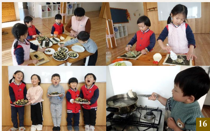
圖 16：動動小手，製作美食，獻給敬愛的親長們享用。