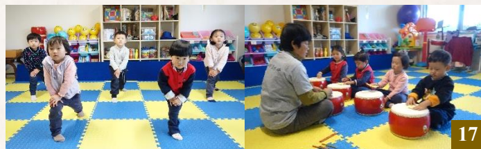
圖 17：同學們能動能靜，在幼兒園的生活豐富又充實。

在這樣豐富又充實的幼兒園生活薰習下，同學們從整理書包、清潔衛生到製作美食、整理寢具，每一項活動都親身參與，在點滴中不斷成長，學會做事有步驟、有條理，逐漸成長為更加獨立、自信的小大人。