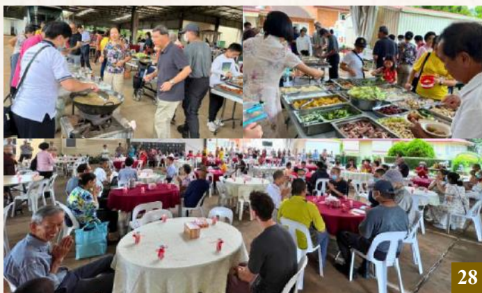
圖 28：澳洲淨宗學院邀請大眾一同享用除夕團圓午餐。