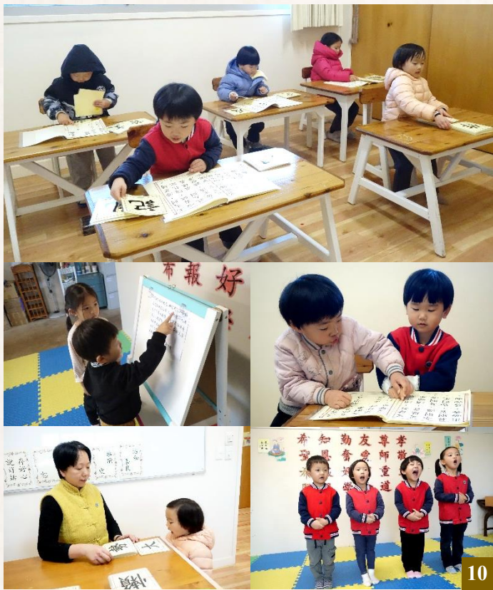
圖 10：「經典讀誦」的意義非凡，是學童打開知識與智慧之門的鑰匙。讀誦經典搭配識字，顯著地提升了同學們認真指讀的信心。

讀誦經典時，同學們各個端正坐姿，眼睛緊隨著手指的移動，口中大聲朗讀，耳朵仔細聆聽自己的聲音，全身心沉浸在經典的韻味之中。讀誦有嚴謹的步驟：首先，每篇生書都要按字數進行「分段讀誦」，需讀 30 遍；接著進行 4 次回顧，每次各讀 20 遍，累計達到 110 遍。完成分段讀誦後，再「通篇讀誦」200 遍以上；同時「背誦」至少 100 遍，請老師驗收。