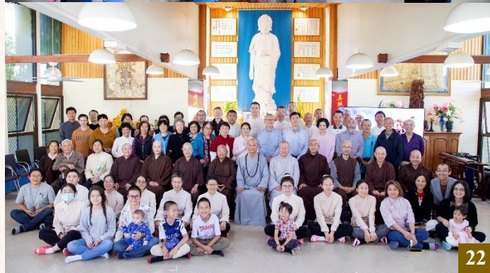
圖 22：RBIT 佛學專業正式開學。開學典禮圓滿落幕後，佛學六級及漢學六級證書課程便正式開始。