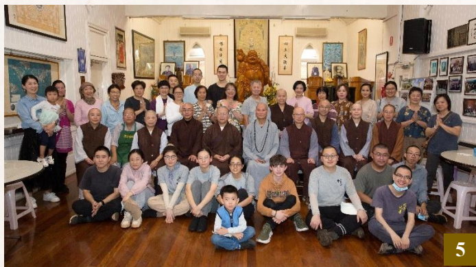
圖 5：3 月 30 日， 上 悟 下 道法師再次蒞臨澳洲淨宗學院，與學院師生親切互動。