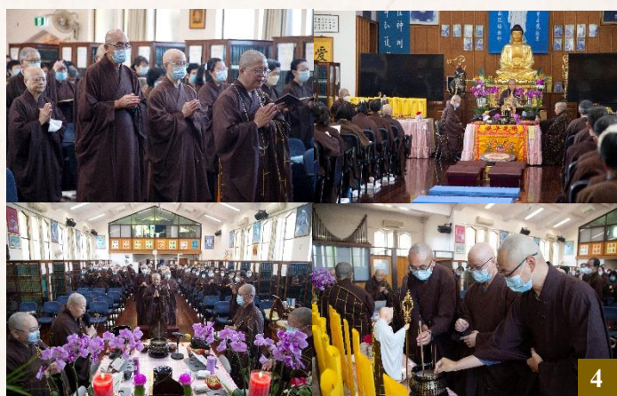
圖 4：3 月 5 日下午舉行三時繫念法會，繫念功德殊勝莊嚴。