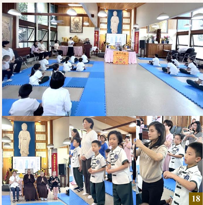
圖 18：明德學校的開學典禮圓滿成功，別具意義。

2024 年 2 月 8 日，圖文巴明德國際學校舉行 2024 年度開學典禮，邀請法師、家長及淨宗學院的貴賓們共同參加，給予學生勉勵與祝福。