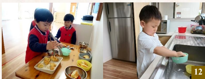
圖 12：享用美味餐點的同時，學生們也在落實生活教育。

幼兒園每日的點心與午餐，都是愛意與溫暖的匯聚。這些餐點皆由家長們精心備製，每一份都蘊含著父母親長的愛與關懷，希望同學們能吃得安心，攝取充足的營養，健康成長。