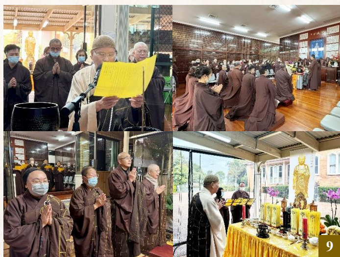
圖 9：為感念師恩，淨宗學院於 5 月 25 日至 5 月 26 日舉辦為期兩天的「先師 上 淨 下 空老和尚生西二週年繫念法會」，恭請 上 悟 下 道法師主法。