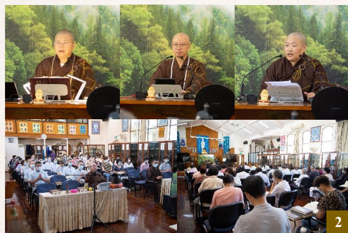
圖 2：2024 年 3 月 2 日至 5 日，淨宗學院舉行先師長善護追思紀念系列活動，首先進行為期三天的報恩講座。