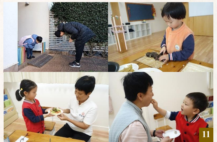
圖 11：心懷感恩，是同學們成長路上重要的一課。每日上學及放學時，真誠地向父母致謝；在校期間則學習如何服侍親長，並學會承擔力所能及的家務。

在老師的持續教導下，同學們正在逐漸養成「父母呼，應勿緩；父母命，行勿懶」的好習慣。聽到父母呼喚，要立即應道：「爸爸 / 媽媽，我就來！」接到父母交辦的事項，要說：「好的，爸爸 / 媽媽，我就去。」並馬上行動。與親長交談時，眼睛注視著對方，用溫和的聲音回應。日常交流中，使用禮貌用語，如：好的、謝謝、請、對不起、請原諒我等，禮貌待人，傳遞溫暖。