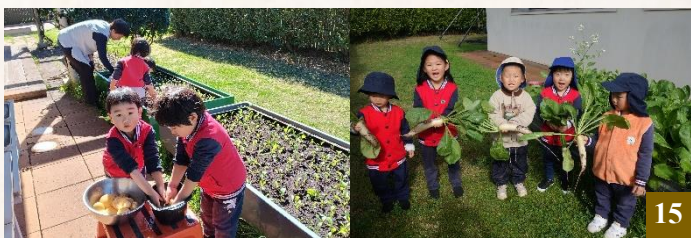
圖 15：大家一起種植蔬菜，並共同享受收成的喜悅。

每週五是同學們期待的美食製作日，老師會帶領他們一起製作壽司和西紅柿炒雞蛋。在製作過程中，同學們會按照步驟，有條不紊地完成每一項任務，比如製作壽司時，先鋪好海苔，再均勻地鋪上米飯，放上喜歡的配菜，最後卷起來切成小段；做西紅柿炒雞蛋時，先打雞蛋、切西紅柿，再點火倒油，依次下鍋翻炒和調味。