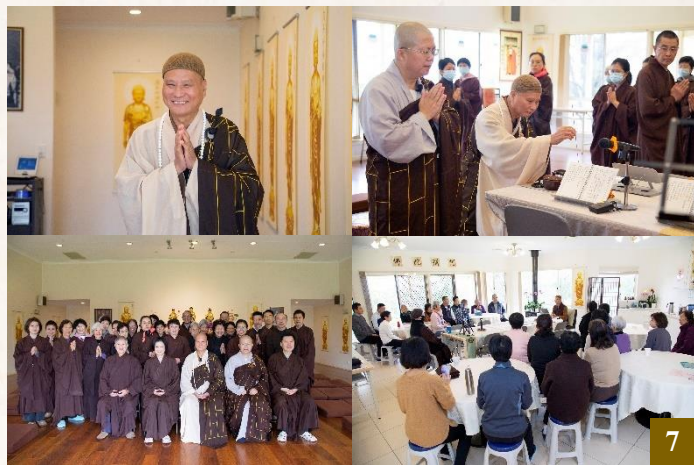
圖 7：5 月 11 日，圖文巴普至念佛堂恭請 上 悟 下 道法師主持念佛共修活動，並為在場同修進行學佛問答，慈悲開示。