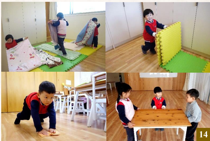
圖 14：藉由習勞，同學們學會分擔家務，長養感恩之心。

午睡時光也是同學們展現自理能力的時刻。同學們自己鋪床、蓋被子；起床後，又會認真地將被子疊好，輕輕放入寢具盒，再把寢具盒放到固定位置。整個過程，同學們都做得一絲不苟，小小的身影透著大大的能量。