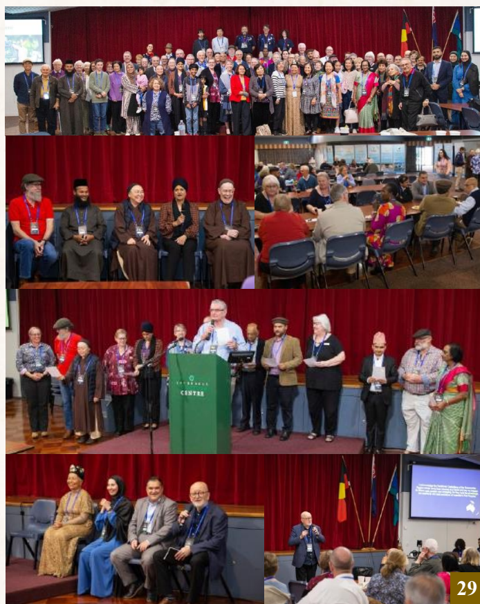
圖 29：5 月 18 日，超過百位具有不同信仰及文化背景的人士齊聚一堂，聆聽論壇講者分享他們寶貴的智慧與經驗，並共同探討如何實現「社會繁榮」。