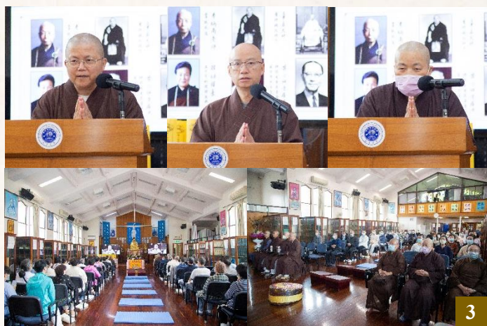
圖 3：3 月 5 日上午，法師代表先後發表追思感言，大眾一同觀看追思紀念影片。