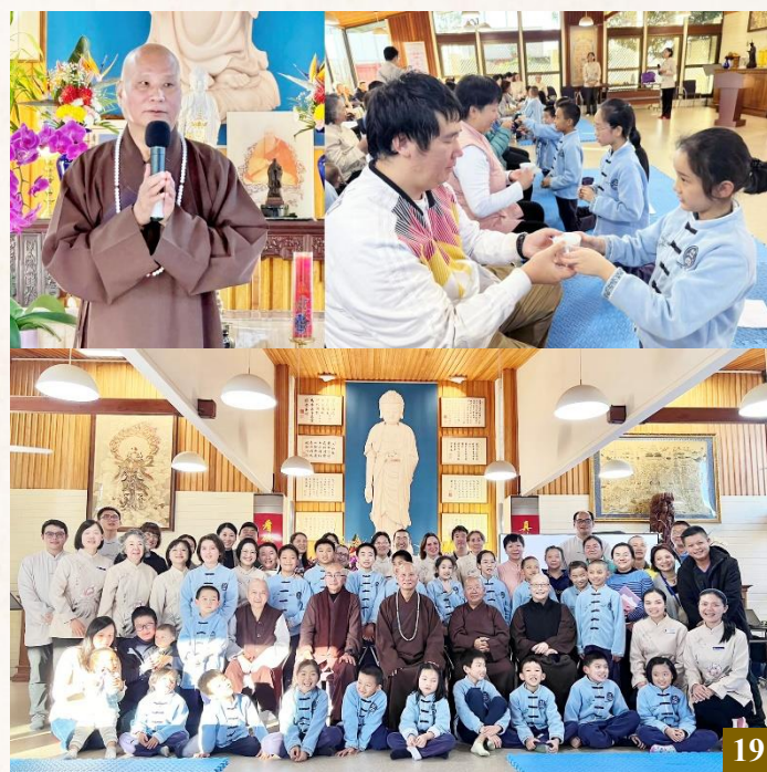
圖 19：藉由簡單莊重的儀式，學生們表達了他們對父母的孝心與敬愛。