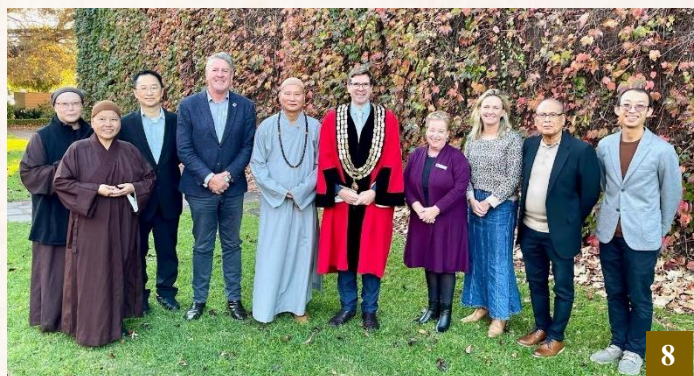
圖 8：5 月 13 日， 上 悟 下 道法師與圖文巴明德國際學校校長等人一同前往圖文巴市政府，拜訪市長及市議員。