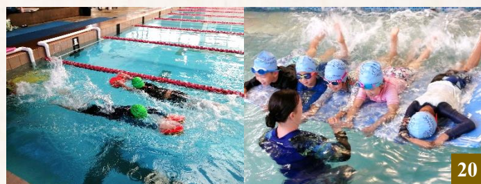
圖 20：2024 年游泳課開課，學生們歡喜地學習漂浮打水。