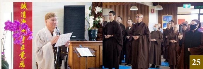
圖 25：大眾全神貫注，恭敬聆聽 上 悟 下 道法師講述佛誕節浴佛的典故及意涵。